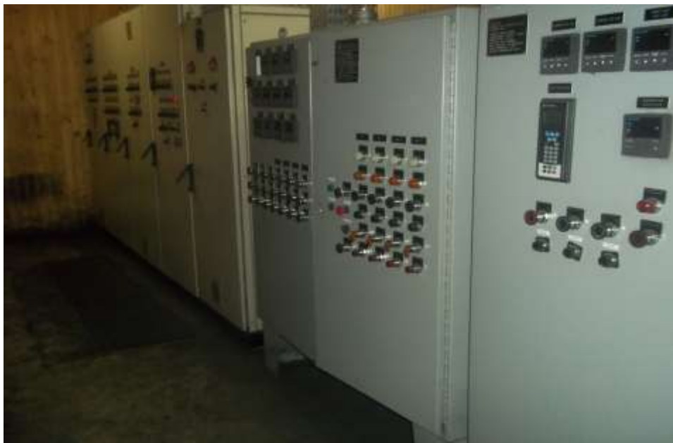
Painéis x automação fabrica