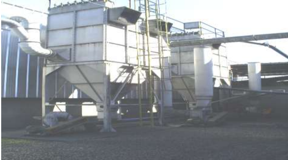
Sistema de exaustão.